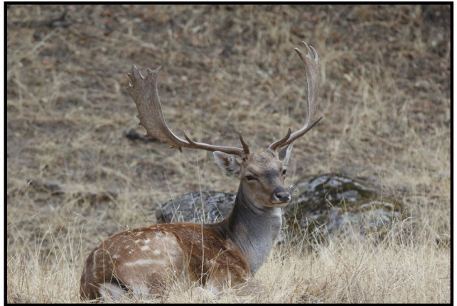
Imagen: Francisco J. Martín Barranco

El gamo es una especie de cérvido que desapareció de gran parte de Europa durante las glaciaciones, quedando relegado a Asia Menor y Turquía. Aunque su presencia en Europa se restableció antes de 1900, no fue hasta la década de 1960 cuando se introdujo en estas sierras, junto con el muflón, con fines exclusivamente cinegéticos en la Reserva Nacional de Caza de Cazorla. Desde allí, la especie ha logrado expandirse y colonizar buena parte del territorio serrano.