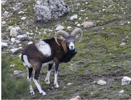
Imagen: Francisco J. Martín Barranco