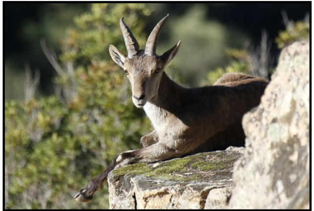
Hembra de cabra montés.

Es una cabra salvaje autóctona y endémica de la península ibérica, la subespecie que tenemos en estas sierras es C. p. hispánica . Existen otras dos subespecies C. p. victoriae -en la Sierra de Gredos- y recientemente, en Sierra Nevada, se ha descrito C. p. nowakiae . Los machos tienen unos cuernos alargados que van creciendo con la edad, por lo que es relativamente sencillo saber si estamos viendo un ejemplar joven o uno viejo. Las hembras también presentan cuernos, pero mucho más pequeños que los machos.