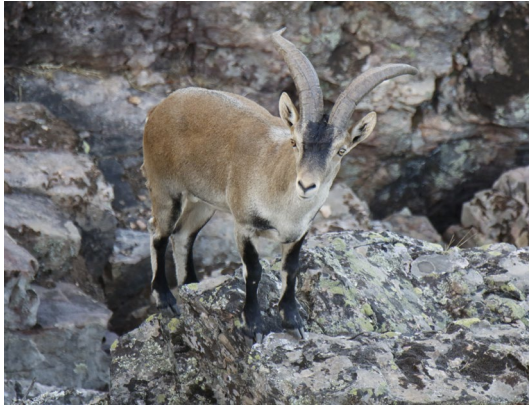
Macho de cabra montés.