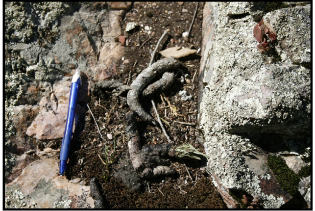
Letrina de gineta.

Son animales solitarios, nocturnos y territoriales, tolerando machos y hembras el solapamiento de otros congéneres de distinto sexo. El marcaje territorial lo hacen a través de sus letrinas y marcas olorosas de manera que saben el estado de cada animal.