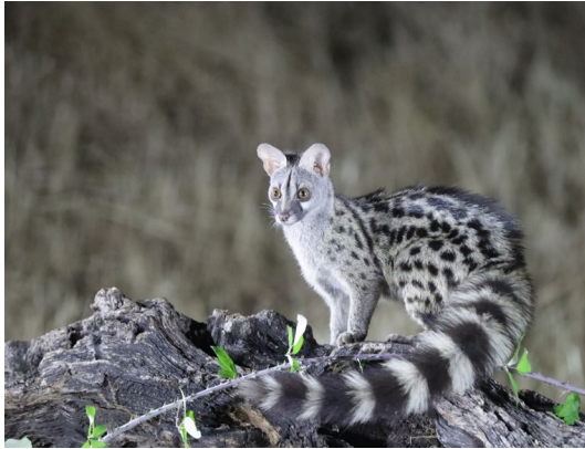
Imagen: Agustín Pérez Armi