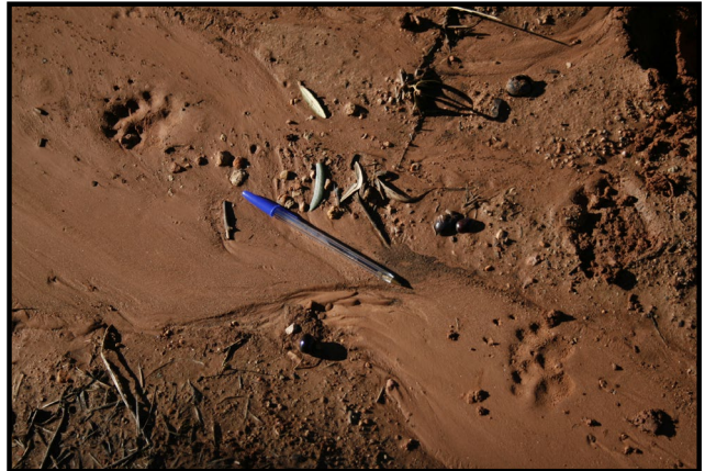
Huellas de tejón.

Es un mustélido de gran tamaño, robusto, con cabeza pequeña, cuello ancho y corto, cuerpo alargado, cola y extremidades cortas y uñas largas y resistentes. La cabeza es de color blanco con dos bandas negras que cubren los ojos, el cuerpo es de color gris en la parte dorsal y más oscuro en la ventral. Es una especie omnívora, provista de unas fuertes garras con largas uñas que le permiten excavar para buscar un amplio elenco de alimentos, desde raíces, tubérculos, lombrices, moluscos y frutos hasta pequeños mamíferos, conejos, anfibios, lagartijas y un largo etcétera. No desdeña la carroña si la encuentra. Se distribuye ampliamente por el Hemisferio Norte, siendo habitual en toda la península ibérica. En el caso de la provincia de Jaén se ha constatado su presencia en todos los ambientes, desde olivares extensos siempre que encuentre áreas de refugio y vegetación natural en arroyos y montes, pasando por bosques, dehesas, pinares, e incluso zonas humanizadas de huertos, frutales, etc.