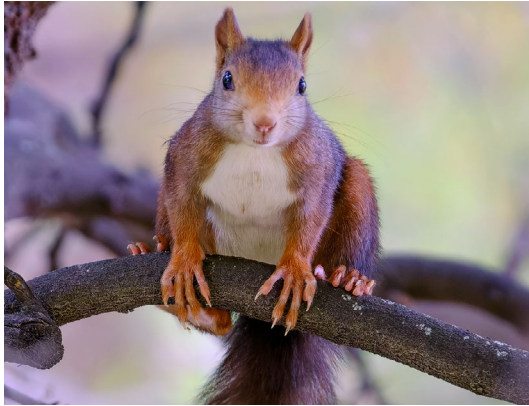
Imagen: Javier Milla