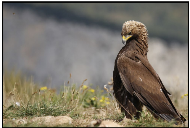
Imagen: F. J. Martín Barranco

La silueta de vuelo es muy característica por su curvatura de las alas hacia arriba, lo que la diferencia de otras rapaces, además de un estrechamiento en la axila.