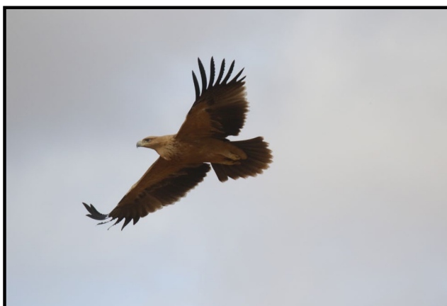
Imagen de individuo juvenil: F.J. Martín Barranco

En la provincia de Jaén, se alberga el 40% de la población andaluza, alrededor de 60 parejas, no habiendo ninguna en el interior del Parque Natural de