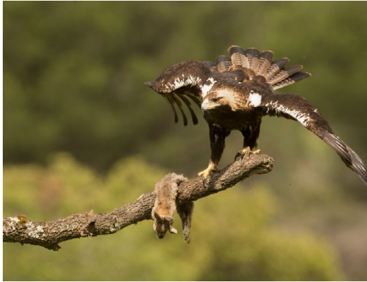
Imagen de individuo adulto: Ivo Paulik