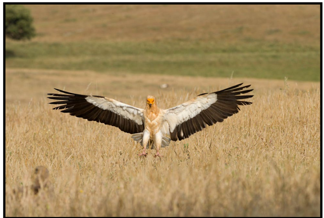
Imagen: Ivo Paulik

Se alimenta de carroña de pequeños y medianos animales. Debido a que prospecta constantemente su territorio, suele ser el primer carroñero en descubrir las carcasas de los grandes