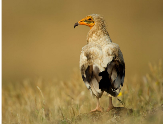
Imagen: Ivo Paulik