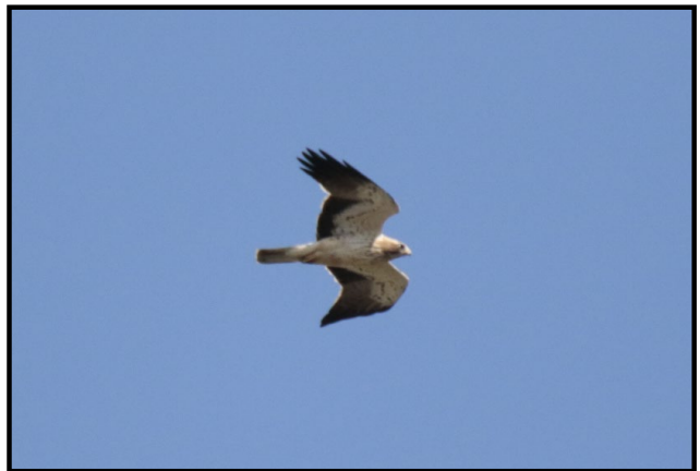
Fase clara.

Su alimentación es muy variada, en función de la abundancia que encuentre, desde conejos, ardillas, medianas aves (arrendajos, mirlos, cornejas, palomas, etc.), reptiles e incluso grandes invertebrados.