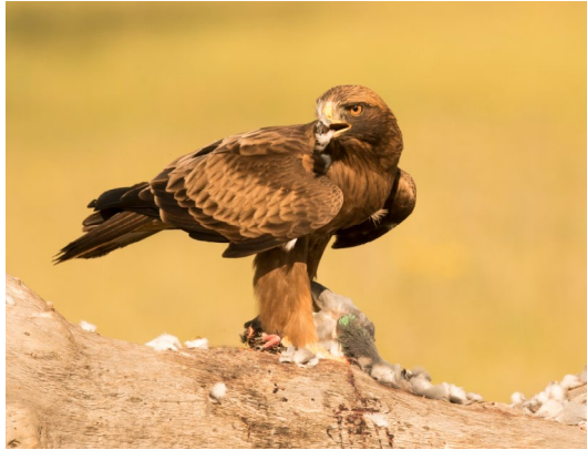
Fase oscura.