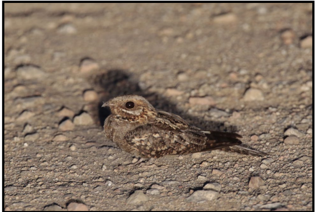
Chotacabras cuellirrojo.