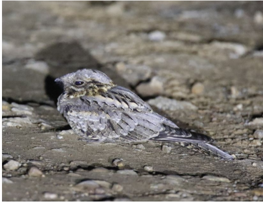
Chotacabras europeo.