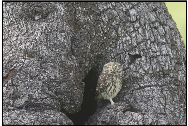
Imagen: F. J. Martín Barranco

La intensificación de la agricultura explica el declive de población del mochuelo europeo en la región mediterránea, en el interior y el sur de la península ibérica, por pérdida de lugares de nidificación y baja disponibilidad de insectos y pequeños mamíferos, base de su alimentación. Además, el atropello, en especial de individuos jóvenes en junio y julio, es también una amenaza para su población.