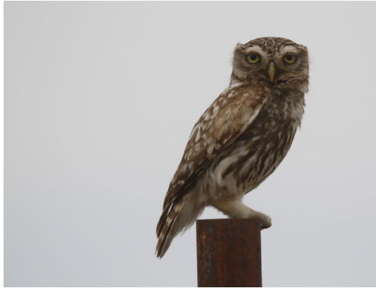
Imagen: F. J. Martín Barranco