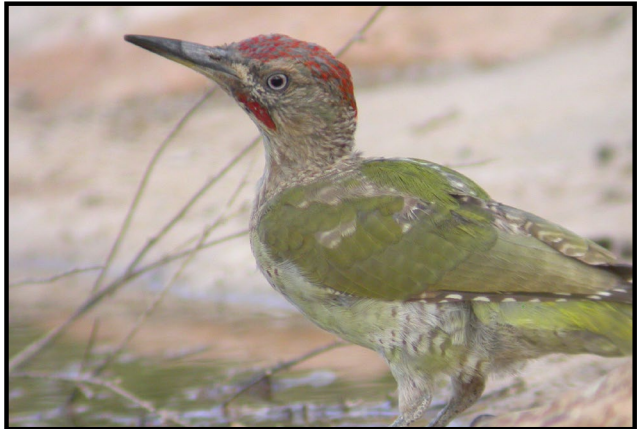
Imagen: F. J. Martín Barranco

Posee una cresta de color rojizo y en el caso de los machos la mejilla de color rojizo y en las hembras de color negro.