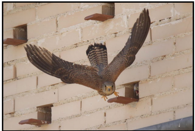
Imagen (hembra): F. J. Martín Barranco

Existe un patente dimorfismo sexual, siendo la hembra de colores ocre y tonos apagados, frente a los machos que tienen la cabeza y parte de las alas de color gris azulado y el dorso de color marrón teja.