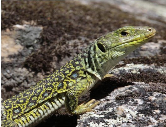
Imagen: F. J. Martín Barranco