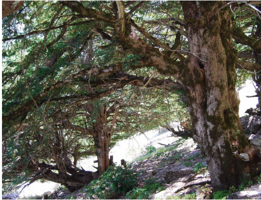
Imagen: A. Benavente Navarro