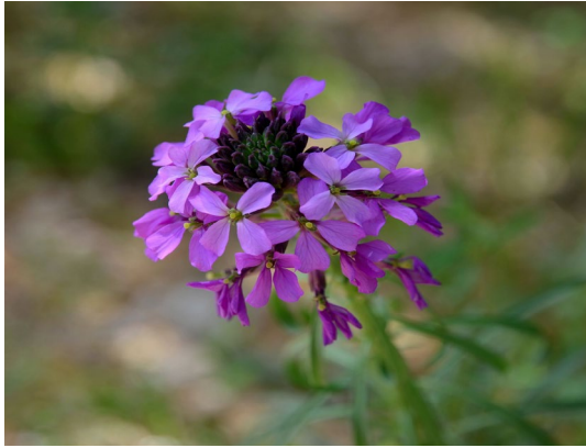
Imagen: A. Benavente