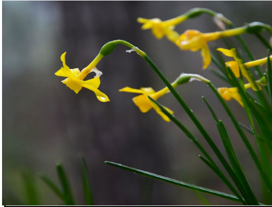
Imagen: A. Benavente