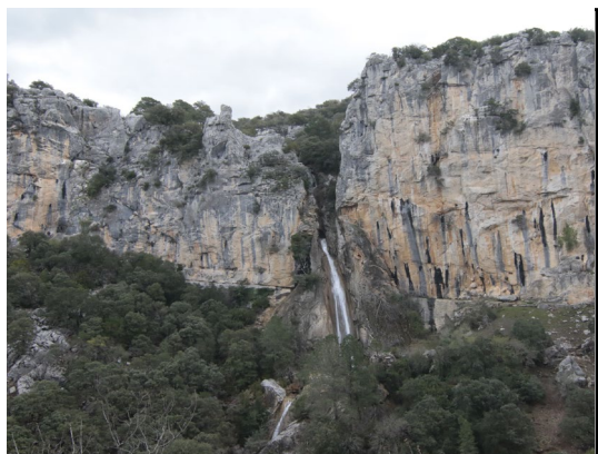
Imagen: F. J. Martín Barranco