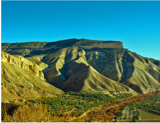
Imagen: F. J. Martín Barranco