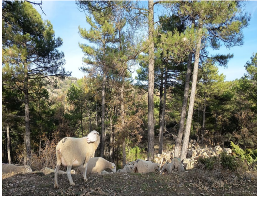
Imagen (ovejas segureñas). F. J. Martín Barranco