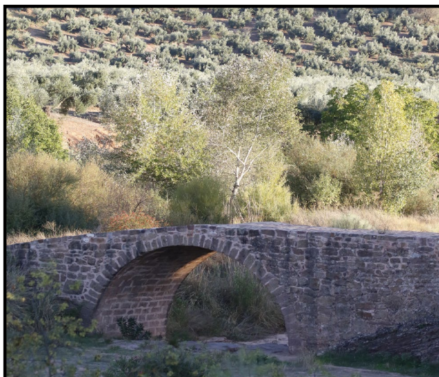
Imagen (Puente Mocho): F. J. Martín Barranco

La región cuenta con infraestructuras históricas clave, como son las vías pecuarias y cañadas reales, las “veredas” como les gusta llamar en estas sierras, o como el